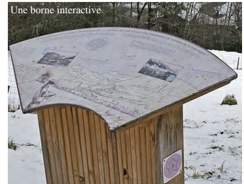
Une borne interactive

... qui étaient les "loup" de Seytroux ?