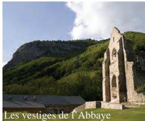
Les vestiges de l'Abbaye

Le Domaine de découverte de la Vallée d'Aulps, comprenant notamment les vestiges majestueux de l'Abbaye Notre Dame d'Aulps, un jardin de plantes médicinales et un potager médiéval, s'étend sur 3 hectares et se visite toute l'année.