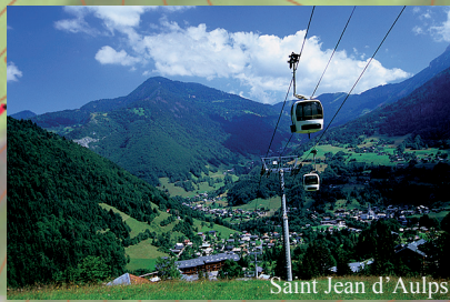
Saint Jean d'Aulps